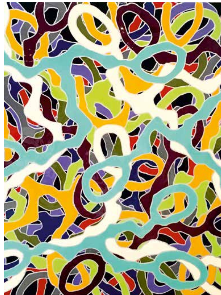
GAMÈTES Peinture polyuréthane sur aluminium 111 x 111 cm